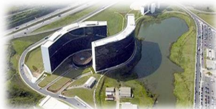
REC - Sapucaí - RJ