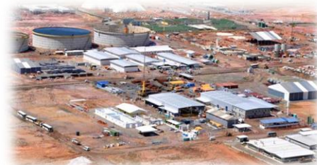
Banco do Brasil - Via Engª